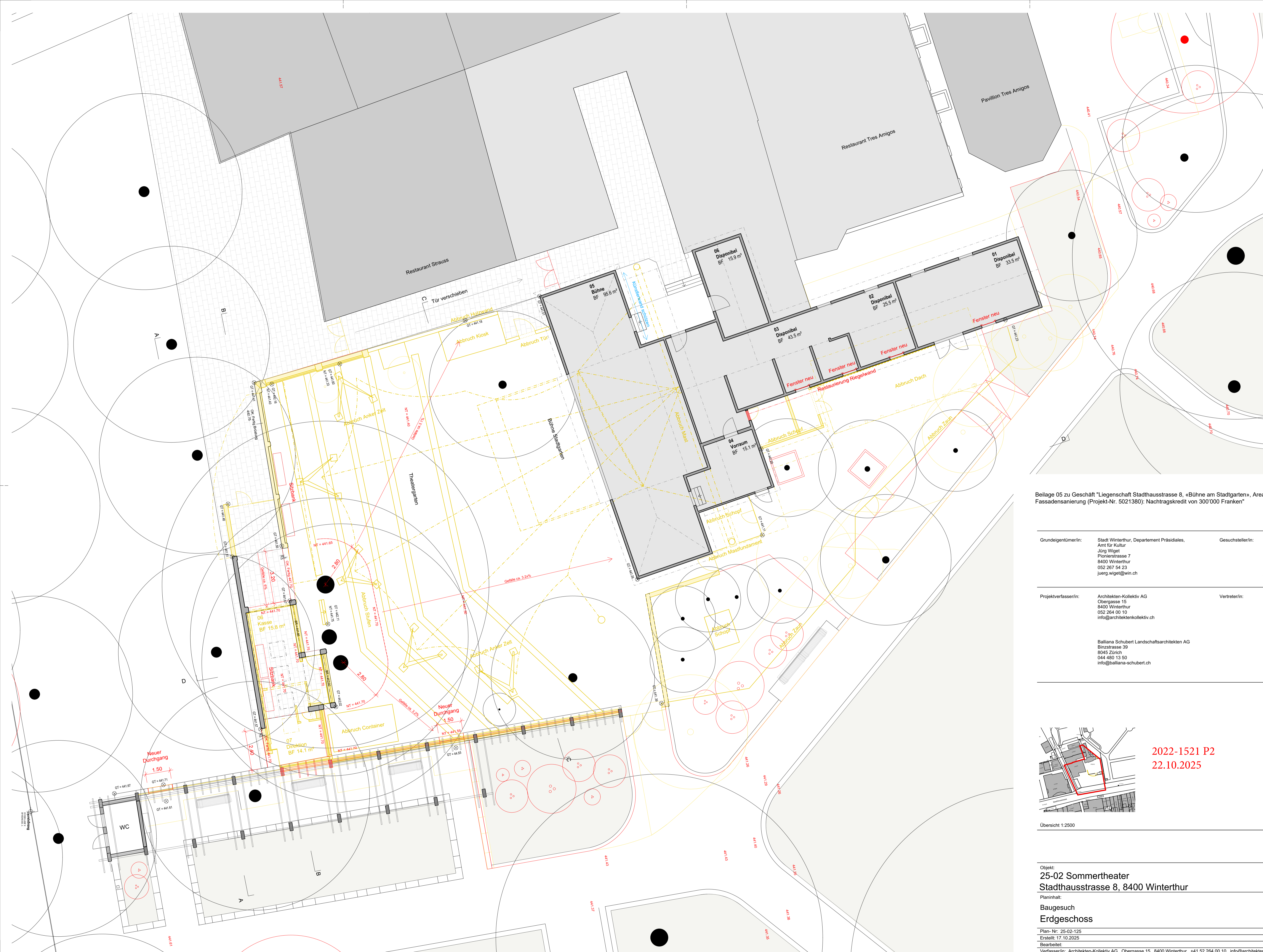
Beilage 05 zu Geschäft "Liegenschaft Stadthausstrasse 8, «Bühne am Stadtgarten», Arealöffnung und Fassadensanierung (Projekt-Nr. 5021380): Nachtragskredit von 300'000 Franken"